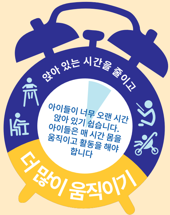
출처 - 호주 신체 활동 및 정착 행동 지침서 및 호주 24 시간 운동 지침서 (0세에서 5세)