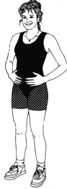
படம்: 'அ': நிறறல்

நியூ செளத் வெய்ல்ஸ் கிளையுடன் தொடர்பு கொள்வதன் மூலம் உங்களுக்கு அருகாமையிலுள்ள மகளிர் நல இயன் மருத்துவர் பற்றி நீங்கள் அறிந்து கொள்ளலாம். இது குறித்து தொலைபேசி மூலம் பேசுவதில் உங்களுக்கு உதவி தேவைப்படின 131450 என்ற எண் மூலம் மொழிபெயர்ப்பு மற்றும் உரைபெயர்ப்பு சேவையை நீங்கள் அழைக்கலாம் அல்லது மருத்துவமனையில் உடல்நலக் கவனிப்புக்கு உதவும் உரைபெயர்ப்பாளர் தேவை என்று கேட்கலாம்.