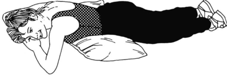
படம்: 'உ': ஓய்வாயிருத்தல்

நீங்கள் கர்ப்பமாய் இருக்கும் போதும், குழந்தைப் பிறப்பைத் தொடரும் ஆரம்ப காலத்திலும் ஓய்வு கொள்ள வேண்டியது மிகவும் அவசியம். இருப்பக்கு அடியில் தலையணை வைத்துக் குப்புறப் படுப்பது குழந்தை பிறப்புக்குப் பின்பு ஓய்வு எடுக்க உகந்த நிலையாகும். குறிப்பாக இது உங்களது இருப்பெலும்புக்கூட்டுப் பகுதிக்கும், முதுகுக்கும் உதவியாய் இருக்கும்.(படம் 'உ' வைப் பாருங்கள்.