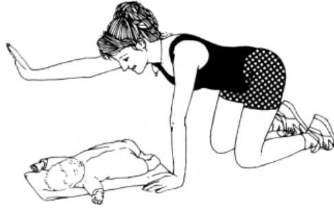
படம் 'ஆ': கால் கைகள் மீது

நினைவில் கொள்ளுங்கள்: இப்பயிற்சியைச் செய்யும்பொழுது எவ்விதத்திலும் இருப்பெலும்பையோ அல்லது முதுகையோ அசைக்கக் கூடாது.