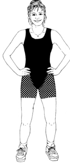
படம்: 'ஈ': இடுப்பெலும்புக்கூட்டைச் சுழற்றுதல்

இப்பயிற்சிகள் முதுகுத்தண்டுப் பகுதியில் நல்ல இயக்க நிலை ஏற்பட உதவும்.